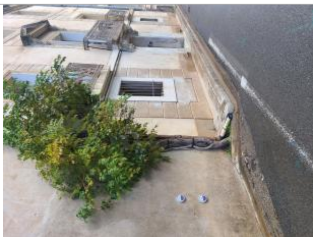
Repères de crue posés sur la façade du n°20