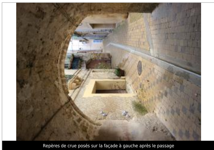
Repères de crue posés sur la façade à gauche après le passage

Altitude calculée de l'eau (en m) : 26.92 m