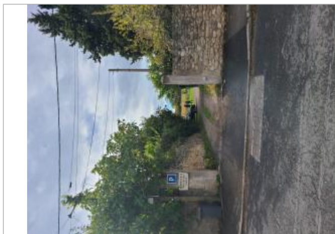
Repère de crue posé sur le poteau d'entrée du parking

Altitude calculée de l'eau (en m) : 25.21 m