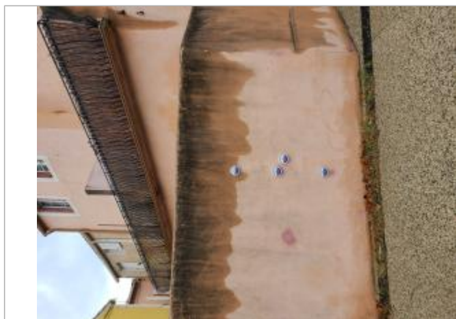
Repères de crue posés sur le mur d'enceinte du n°10

Méthode : Non renseigné Référence nivelée : Marque d'inondation Système altimétrique : NGF IGN 1969 (système normal) Altitude de la référence (en m) : 27.290 m Altitude calculée de l'eau (en m) : 27.29 m