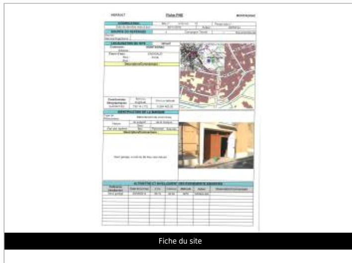
Fiche du site

Coordonnées WGS84 : X: 3.48358960 / Y: 43.47820130