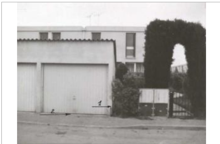
Photo du site