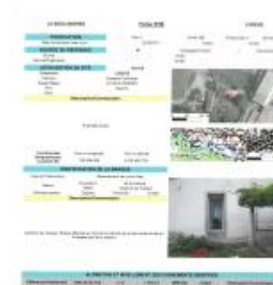
Fiche du site

Coordonnées RGF93 (ETRS89) : X: 3.313544 / Y: 43.730901