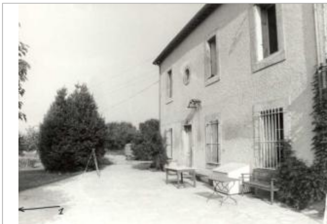
Photo du site