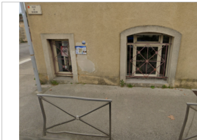
place de verdun

Coordonnées RGF93 (ETRS89) : X: 3.9014408 / Y: 43.5673727