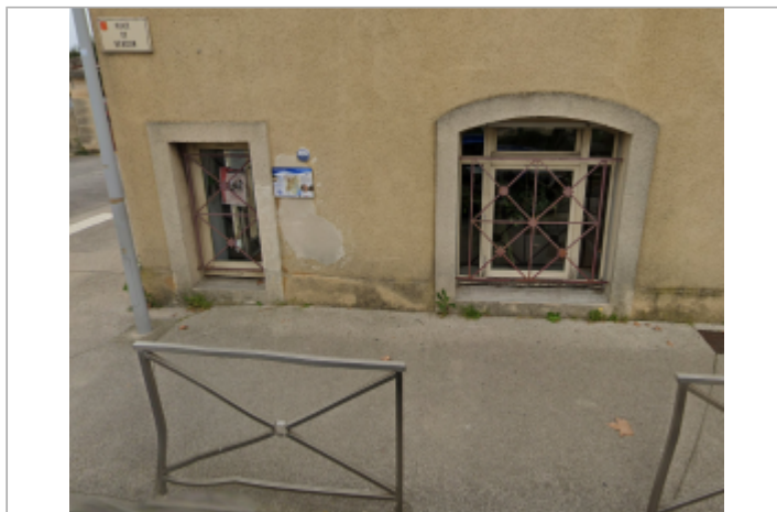
place de verdun