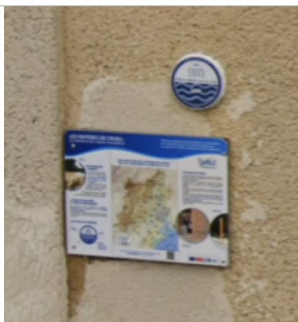
macaron place verdun