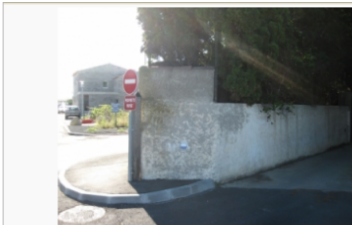
mas de jaumes Lattes