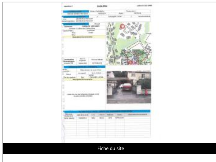
Fiche du site