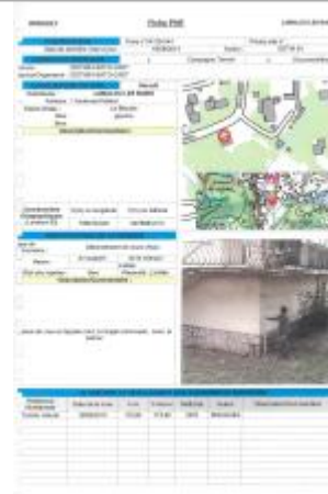
Fiche du site

Coordonnées RGF93 (ETRS89) : X: 3.0844106 / Y: 43.5909714