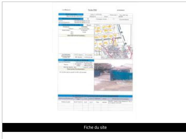
Fiche du site