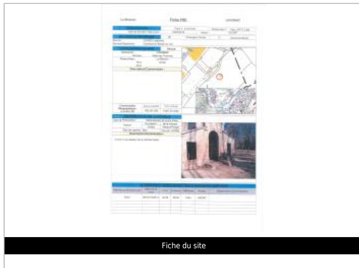
Fiche du site