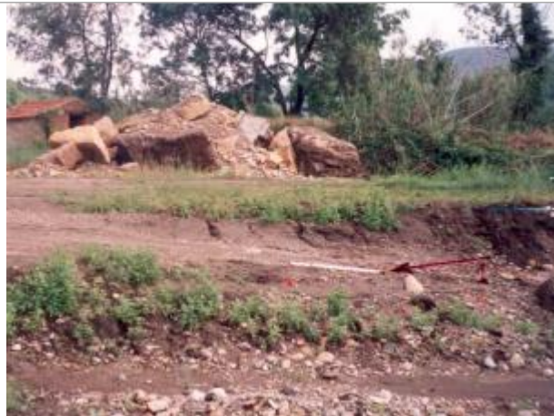
Photo du site