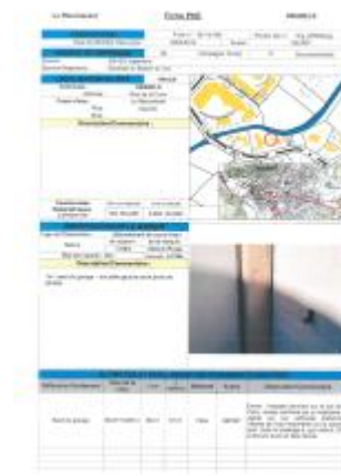
Fiche du site

Coordonnées RGF93 (ETRS89) : X: 3.8022434 / Y: 43.6443696