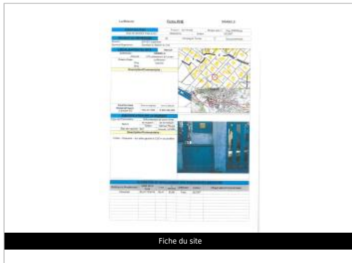
Fiche du site