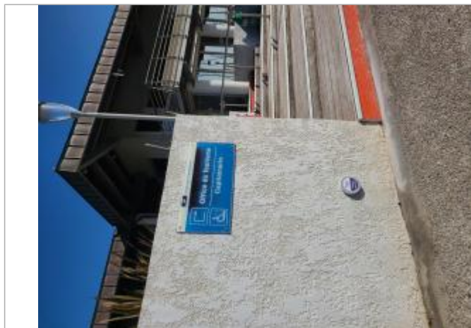
Repère de crue au niveau de la capitainerie (côté étang)

Altitude calculée de l'eau (en m) : 1.3 m