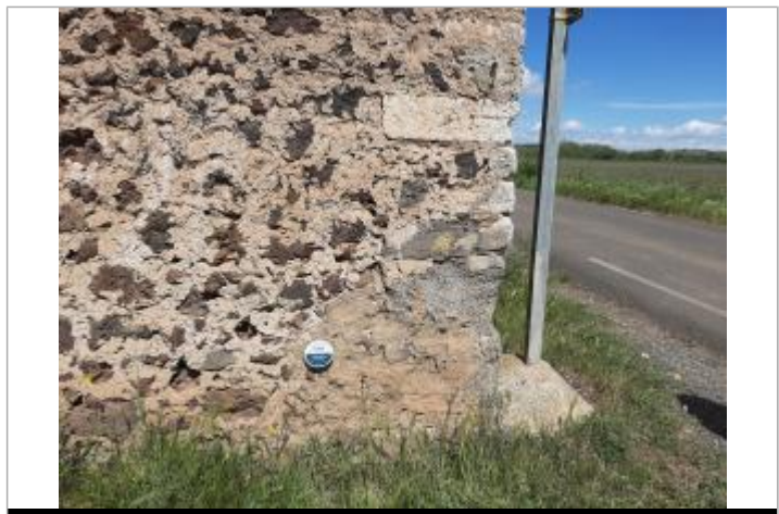
repere dans coin du bâtiment.

GÉNÉRAL Code : DDTM_R_34101-011_11 Date de mise à jour : 08/04/2024 Auteur : DDTM34