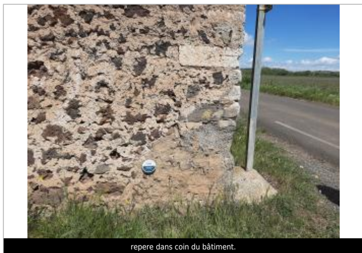
repere dans coin du bâtiment.

Texte : 1997 Maximum de l'inondation : Oui Visibilité : Oui État du repère : Bon Pérennité : Longue Repère calculé : Non renseigné PHEC : Non renseigné