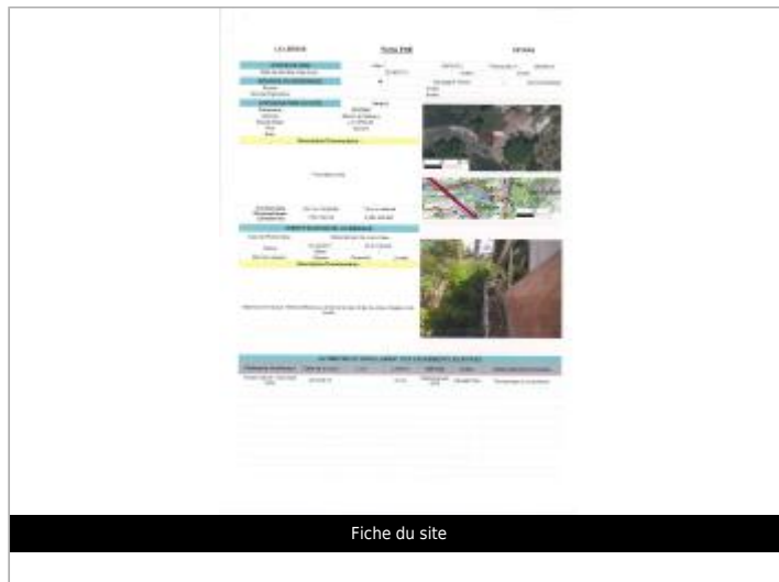
Fiche du site

Coordonnées RGF93 (ETRS89) : X: 3.436562 / Y: 43.6662828