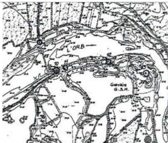
Croquis du site