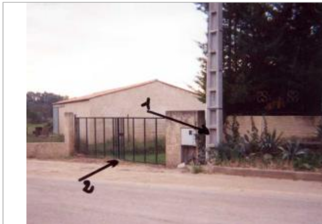
Photo du site