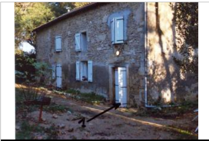
Photo du site

GÉOLOCALISATION Coordonnées WGS84 : X: 4.08229595 / Y: 43.76272760 Coordonnées RGF93 (Lambert 93) X: 787165.49 / Y: 6296564.78 Coordonnées RGF93 (ETRS89) : X: 4.082296 / Y: 43.7627276