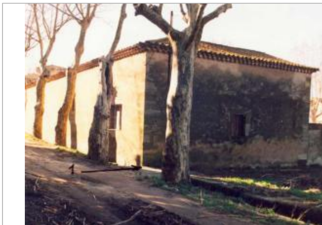
Photo du site