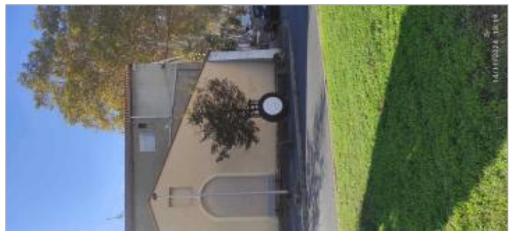
vue du site actuel

GÉOLOCALISATION Coordonnées WGS84 : X: 3.20414605 / Y: 43.33785560 Coordonnées RGF93 (Lambert 93) X: 716564.01 / Y: 6248766.69 Coordonnées RGF93 (ETRS89) : X: 3.2041461 / Y: 43.3378556 Code Hydro: Y25-0400 Rive de référence: