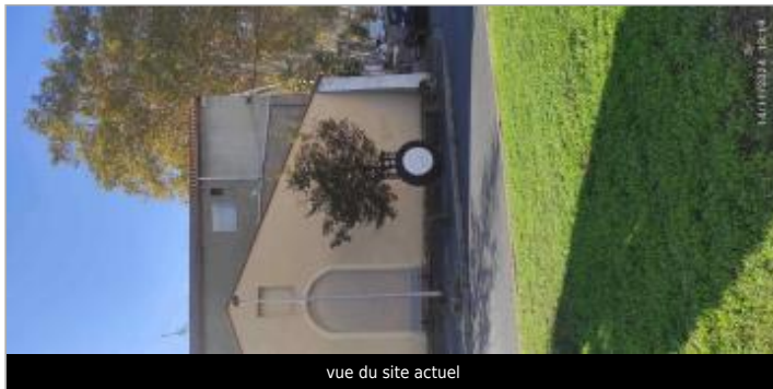
vue du site actuel

GÉOLOCALISATION Coordonnées WGS84 : X: 3.20414605 / Y: 43.33785560 Coordonnées RGF93 (Lambert 93) X: 716564.01 / Y: 6248766.69 Coordonnées RGF93 (ETRS89) : X: 3.2041461 / Y: 43.3378556 Code Hydro: Y25-0400 Rive de référence: