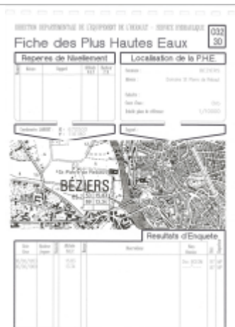
beziers domaine st pierre de rebaut

Altitude calculée de l'eau (en m) : 13.28 m