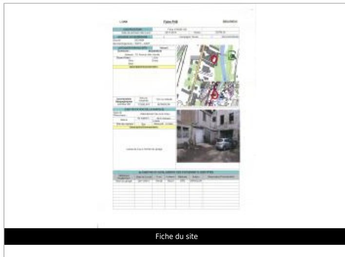
Fiche du site

Coordonnées RGF93 (ETRS89) : X: 3.1518507 / Y: 43.6101552