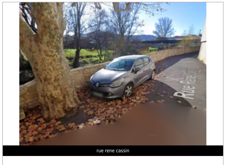
rue rene cassin