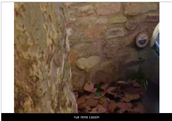
rue rene cassin