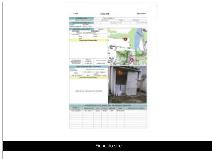
Fiche du site