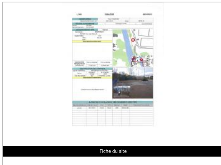
Fiche du site