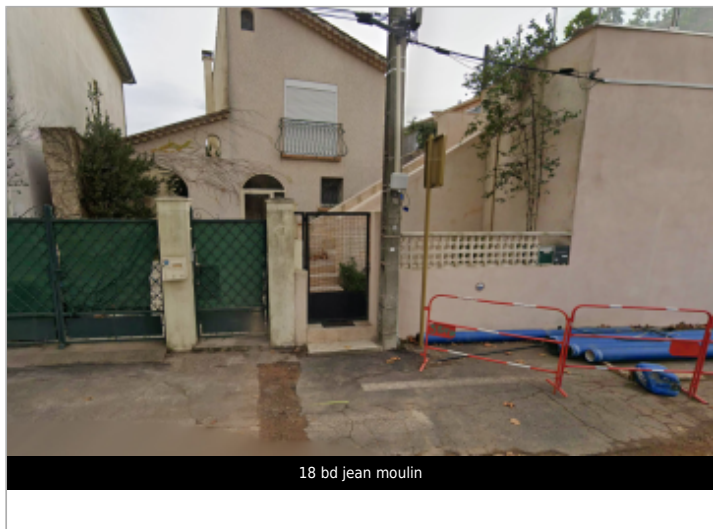
18 bd jean moulin