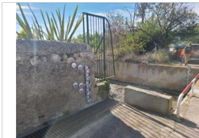
Repères posés sur le mur en rive gauche

Altitude calculée de l'eau (en m) : 2.26 m