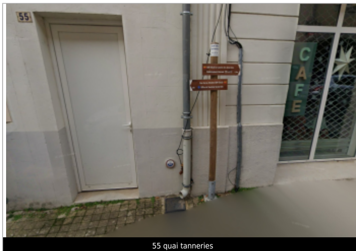
55 quai tanneries

Coordonnées WGS84 : X: 3.10095048 / Y: 43.75744670