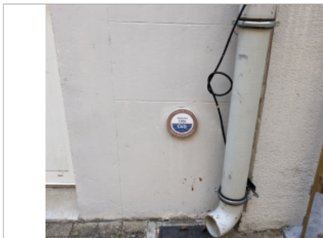
repere 55 quai des tanneries