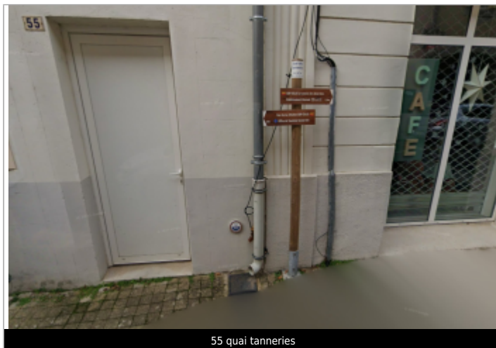
55 quai tanneries

GÉOLOCALISATION Coordonnées WGS84 : X: 3.10095048 / Y: 43.75744670 Coordonnées RGF93 (Lambert 93) X: 708131.31 / Y: 6295385.75 Coordonnées RGF93 (ETRS89) : X: 3.1009505 / Y: 43.7574467 Code Hydro: Y25-0400 Rive de référence: