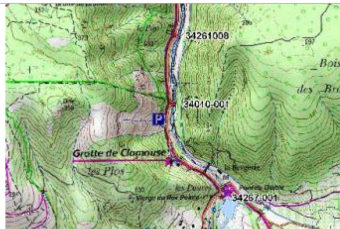
Croquis du site