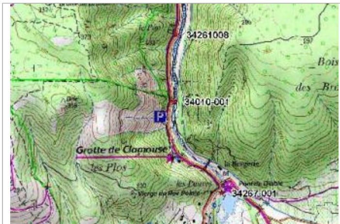
Croquis du site