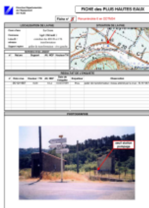
fiche_agel_carrefour rd20 rd176

Altitude calculée de l'eau (en m) : 81.57 m