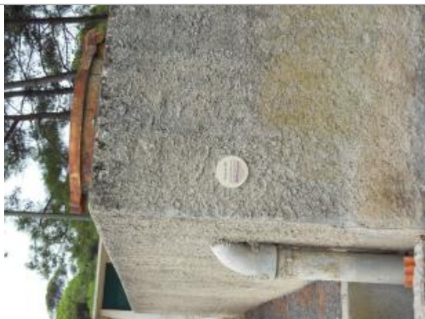
repere sur mur enceinte camping

Altitude calculée de l'eau (en m) : 1.79 m