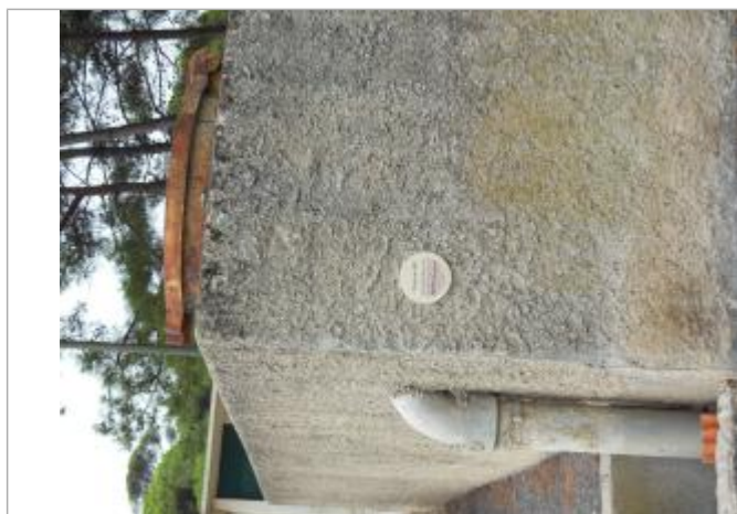
repere sur mur enceinte camping