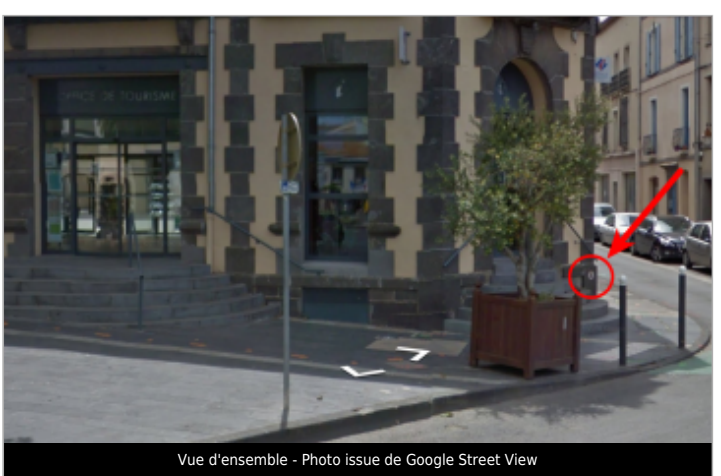
Vue d'ensemble

GÉOLOCALISATION Coordonnées WGS84 : X: 3.47089430 / Y: 43.31500800 Coordonnées RGF93 (Lambert 93) : X: 738222.4 / Y: 6246319.46 Coordonnées RGF93 (ETRS89) : X: 3.4708943 / Y: 43.315008