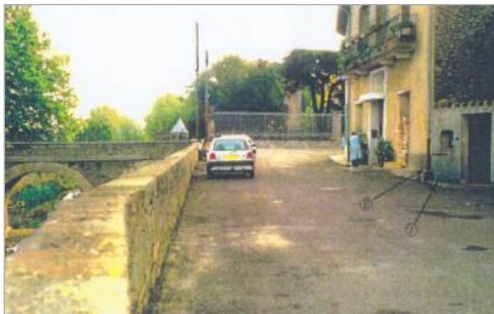
Photo du site