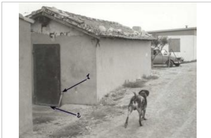
Photo du site