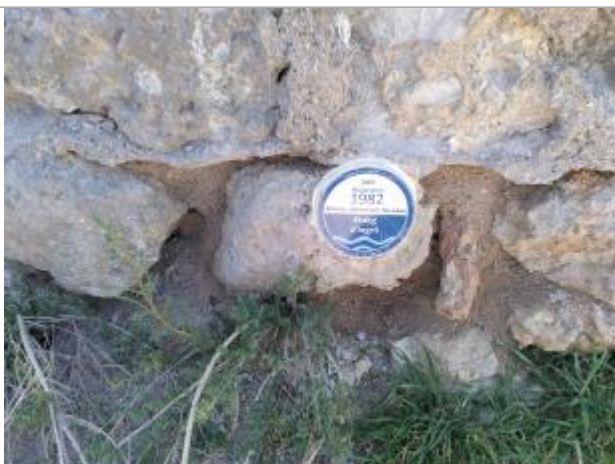
Zoom sur le repère de crues