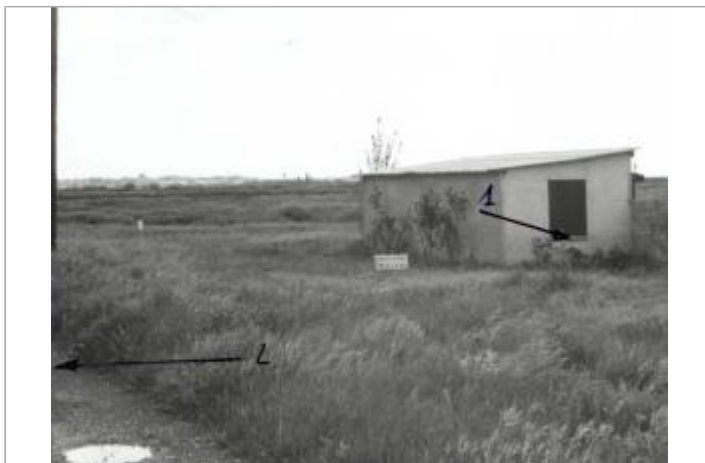
Photo du site