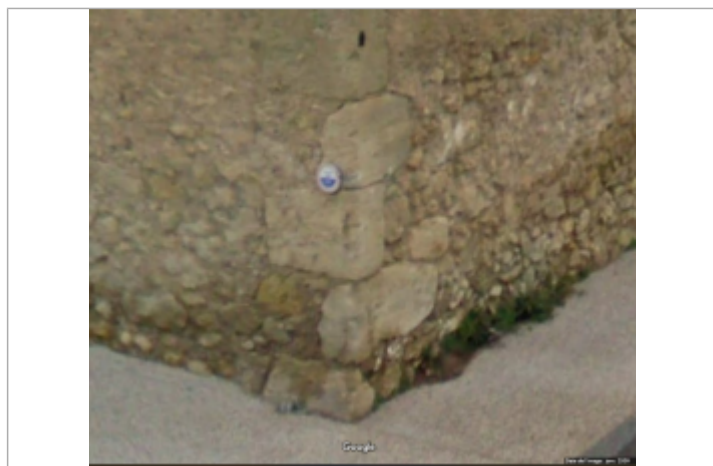
croisement rue orb et des ecoles

Altitude calculée de l'eau (en m) : 7.24