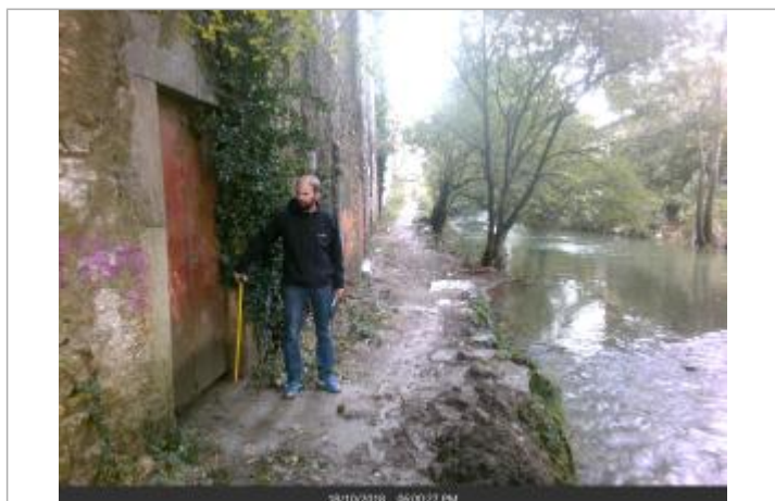
Porte en fer rouillée à coté du cours d'eau