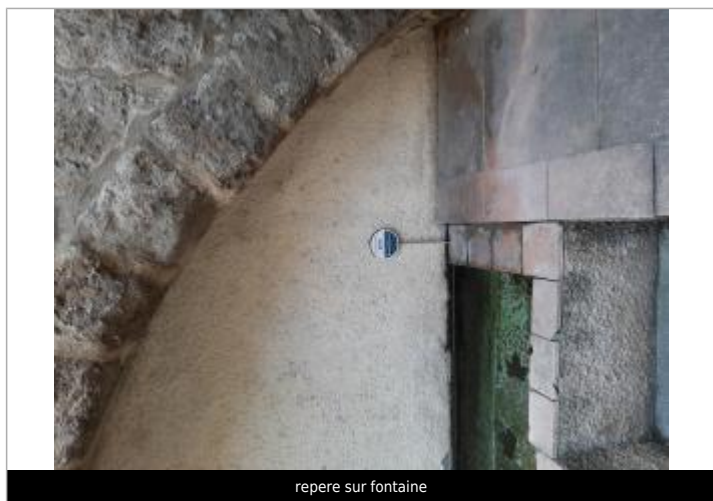
repere sur fontaine