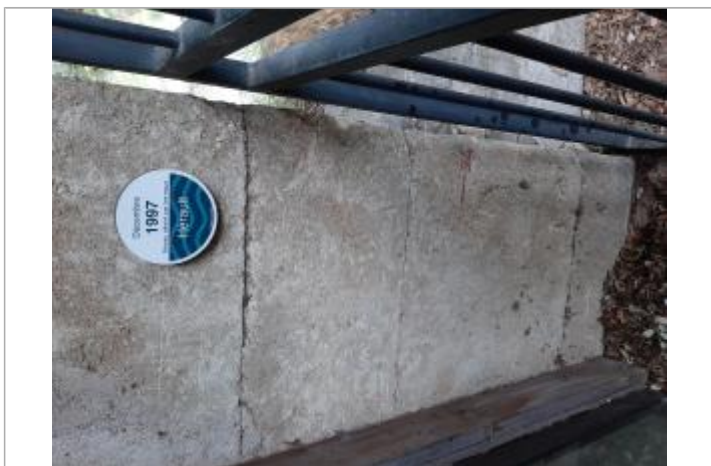
entrée du bâtiment

Texte : 18 decembre 1997 Maximum de l'inondation : Oui Visibilité : Oui État du repère : Bon Pérennité : Longue Repère calculé : Non renseigné PHEC : Non renseigné