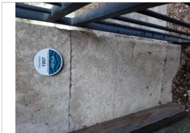
entrée du bâtiment

Texte : 18 decembre 1997 Maximum de l'inondation : Oui Visibilité : Oui État du repère : Bon Pérennité : Longue Repère calculé : Non renseigné PHEC : Non renseigné