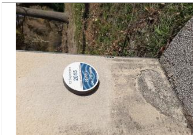
repère posé sur le viestaire du stade