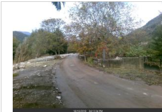
Poteau le long du muret, à la moitié de la propriété